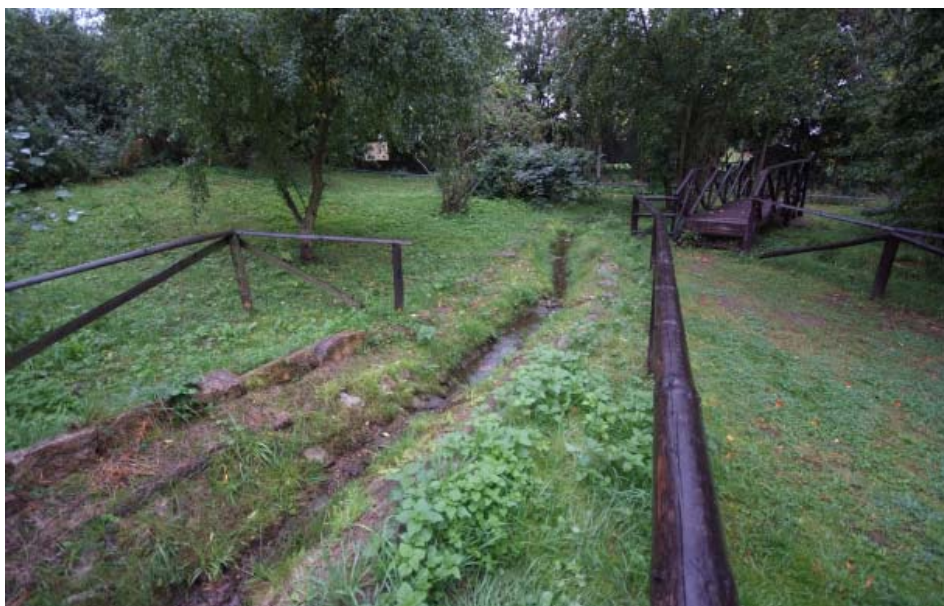
Abb. 2: Ein Bachlauf verbindet die Teiche untereinander. Teiche und Bachlauf sind in Folienbauweise ausgeführt.