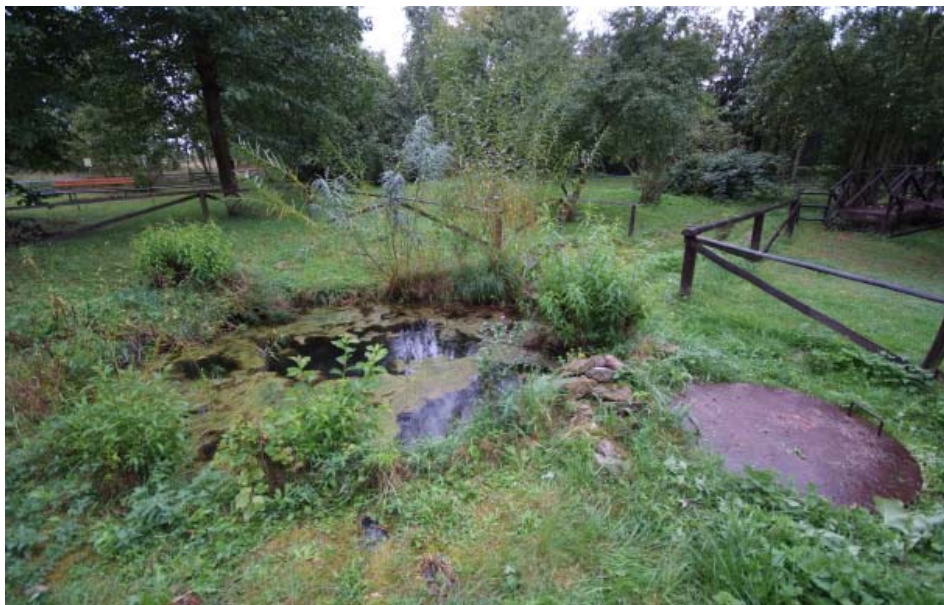
Abb. 1: Der obere der drei Kleinteiche mit dem Wassersammelschacht, in dem sich die Tauchpumpe befindet. Diese ist derzeit nicht ständig in Betrieb, sondern wird oft abgeschaltet.